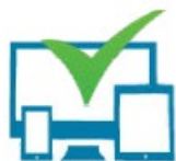
Briefing par Email